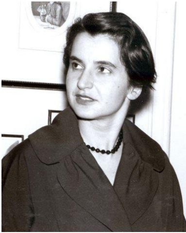
Rosalind Franklin (1920-1958)

1. En 1962, se otorgó el Premio Nobel de Fisiología y Medicina a Maurice Wilkins, James Watson y Francis Harry C. Crick por su contribución al descubrimiento de la estructura molecular del ácido desoxirribonucleico (AND). Sin embargo, miembros destacados de la Comunidad Científica echaron de menos que también fuera reconocida la labor de Rosalind Franklin , científica que no fue mencionada en momento alguno por sus colegas.